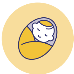
時短勤務制度 (就学前の子・孫)