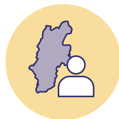
長野市共済会加入